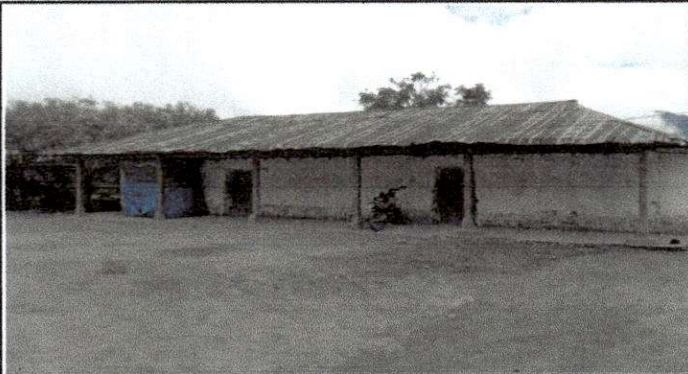
Foto1: Cubierto de lámina